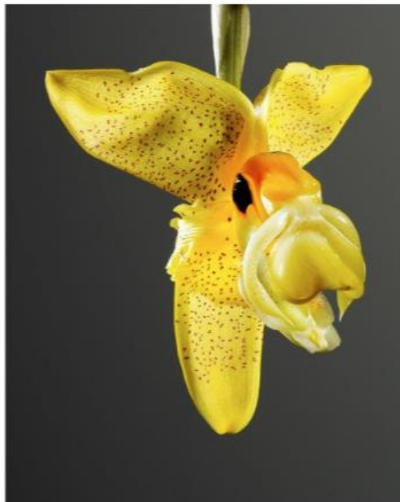
Und auch die Orchidee Stanhopea embreei hat der „Botschafter der Blumen“ Richard Fischer eindrucksvoll abgebildet.