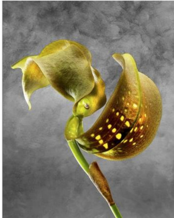
Bulbophyllum grandiflorum: eine blühstarke Orchidee.