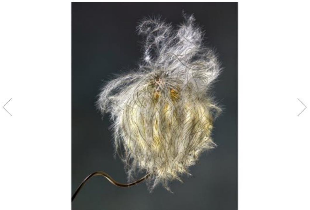
Eine Clematis, auch Walrebe genannt, ist eine beliebte Kletterpflanze.