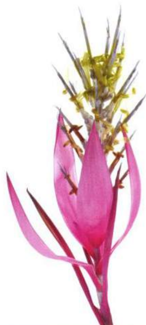
Rare flowers series