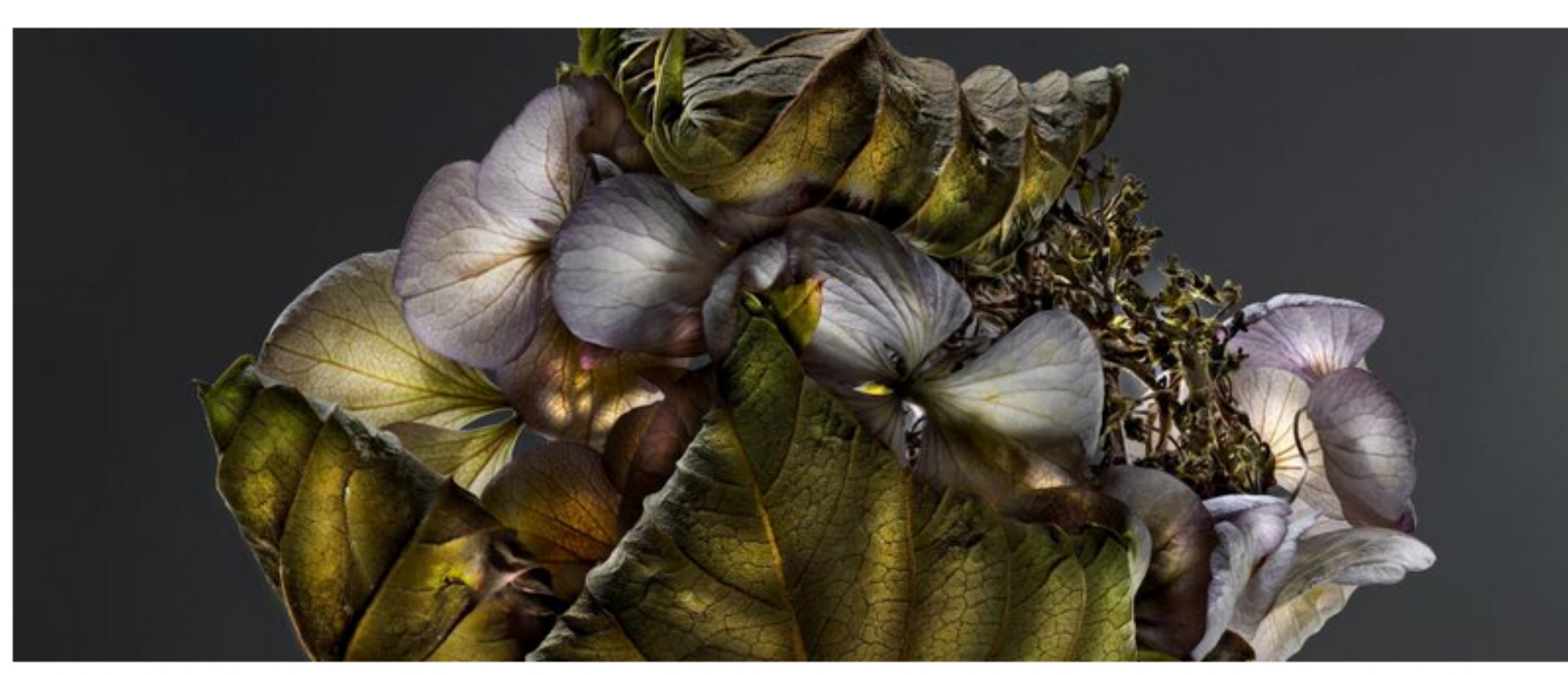
In der Serie Dying Divas will Fischer den Moment des Verwelkens festhalten. Hier sind es Hortensien, die verblühen

Dabei geht es ihm nicht um die genaue botanische Bezeichnung, im Buch wurde absichtlich darauf verzichtet. Für die freizeit hat ein Mitarbeiter der Botanischen Universität Wien das Blumenrätsel der poetischen Fotos entschlüsselt. Fotograf Fischer: „Ich will ausschließlich durch die Schönheit der Blumen Menschen animieren, etwas für den Planeten zu tun.“