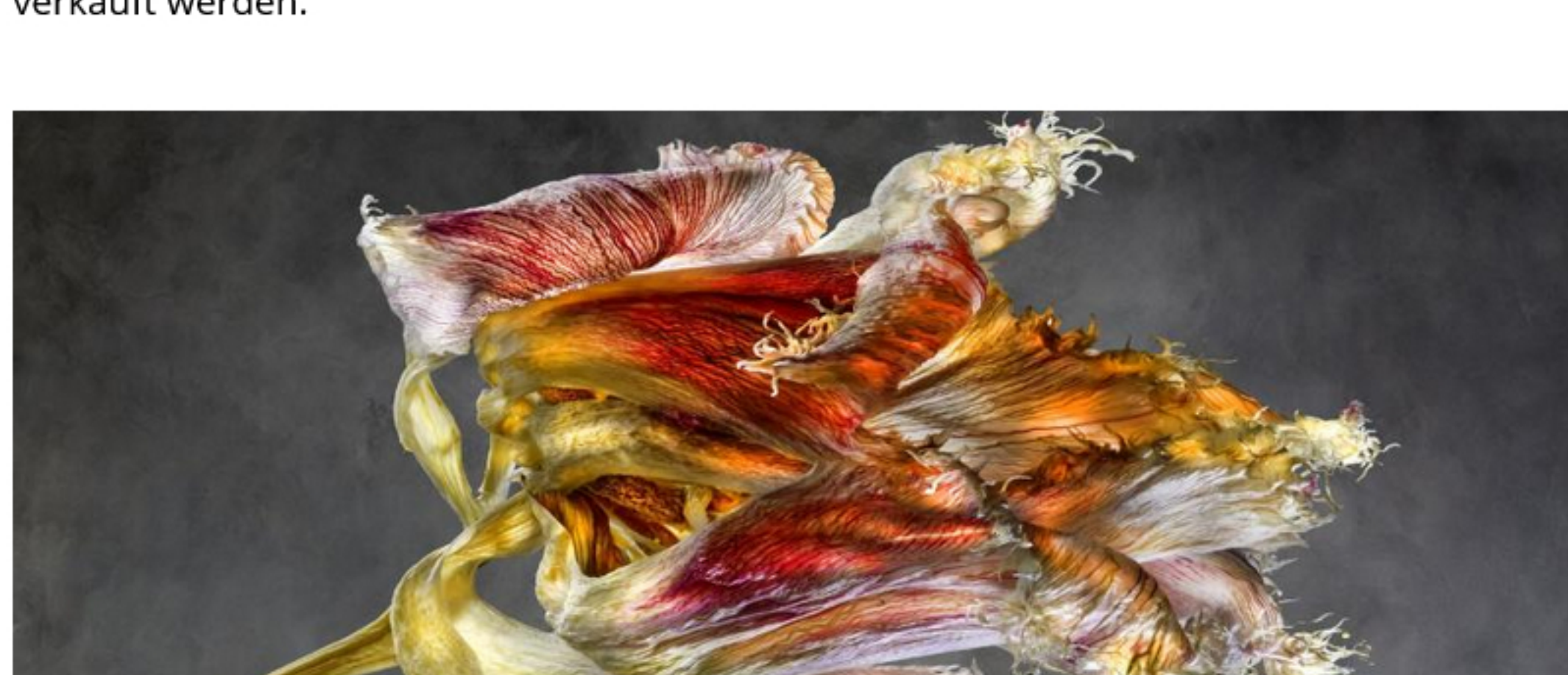
Bei dieser Dying Diva konnte es sich laut Bröderbauer um eine Tulpe handeln

Neben dem Kultivieren gefährdeter Arten ist besonders der Erhalt der Artenvielfalt im Garten wichtig. Jährlich im April findet, heuer vom 19. bis 21. April, im Botanischen Garten Wien eine Raritätenbörse statt, bei der neben Zierpflanzen auch einheimische Arten verkauft werden.