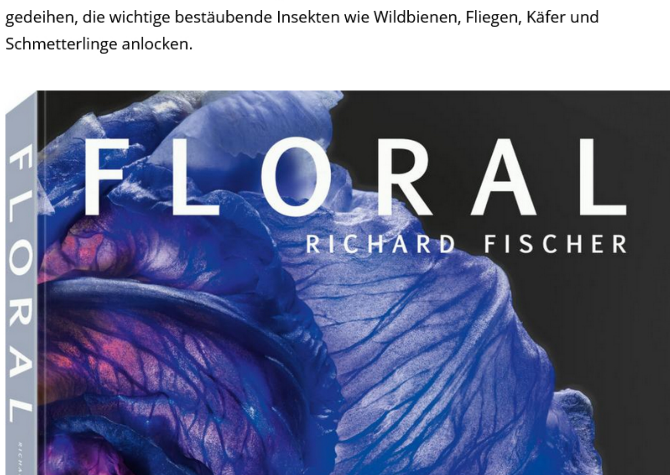
Floral, Richard Fischer, Hardcover, Deutsch & Englisch, 208 Seiten, 100 Farbphotografien, TeNeues Verlag GmbH, 80 €

„Jeder einzelne kann zur Artenvielfalt beitragen“, sagt der Experte. „Im privaten Garten geht es eher darum, dass Gartenbesitzer ihre Gärten mit viel mehr einheimischen Arten bepflanzen und naturnah kultivieren, Wildwuchs zulassen und keine Pestizide verwenden.“ So werden Wildtiere angelockt und Wildpflanzen können im Garten gedeihen, die wichtige bestäubende Insekten wie Wildbienen, Fliegen, Käfer und Schmetterlinge anlocken.