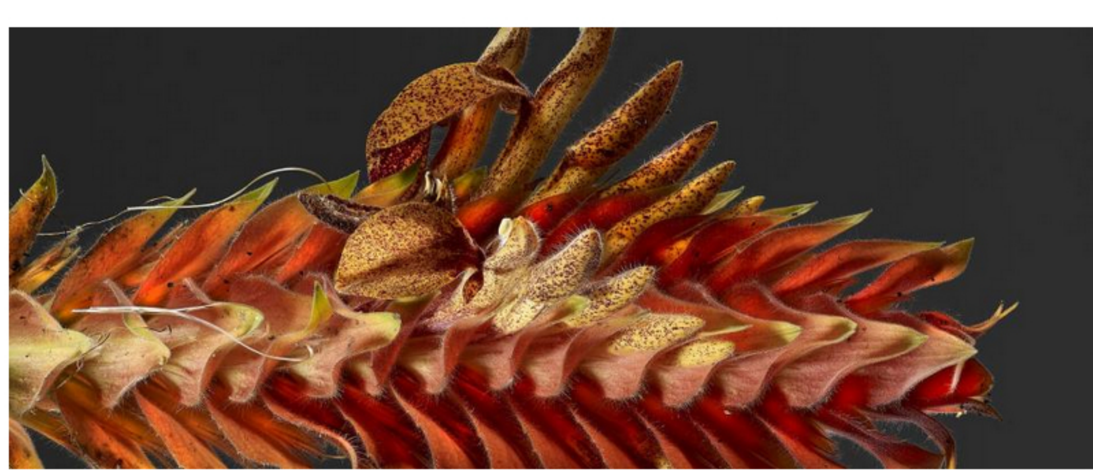
Hier zeigt Fotograf Fischer ein verblühendes Glanzkolbchen

Auch Wien hat eine Gartenanlage, in der exotische und seltene einheimische Pflanzenarten nach verwandtschaftlichen geografischen und ökologischen Aspekten gepflanzt werden.