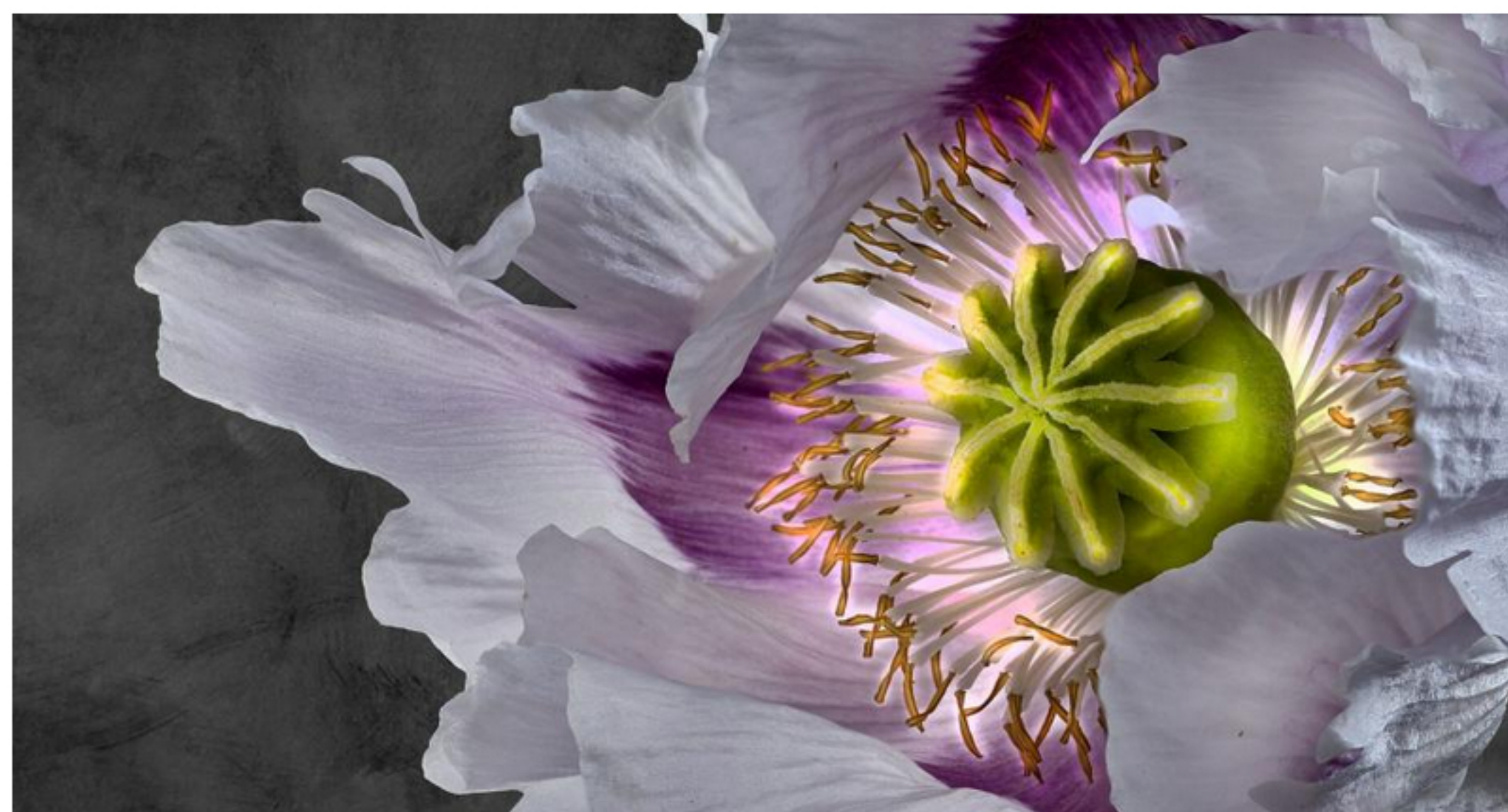
Das Bild der Serie Floral Finesse zeigt Schlafmohn