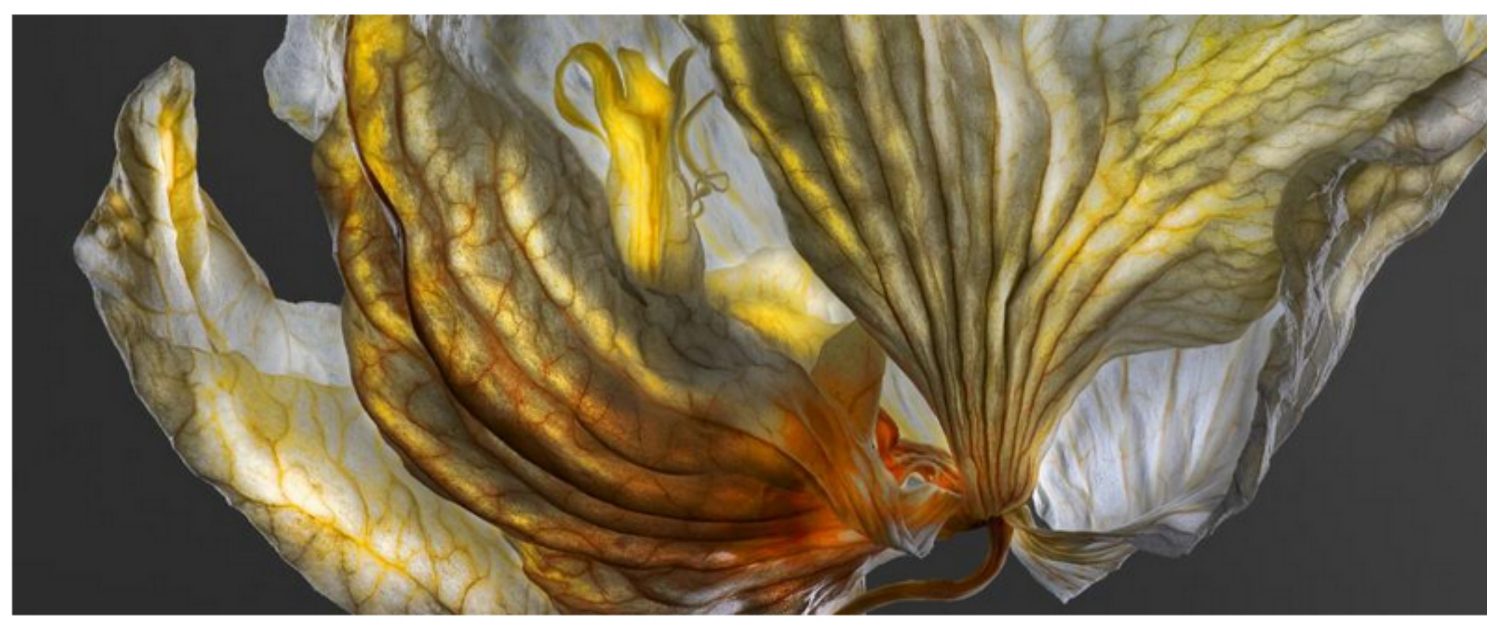
Dying Divas zeigt das letzte Kapitel floralen Lebens und ist eine Hommage an den Abschied, hier an den von einer Orchidee

Sein fantastisches Kunstprojekt in Close-up-Technik soll Menschen anregen, gegen Klimawandel und Artensterben aktiv zu werden. Blumen sind essenzielle Nahrungsquellen, in der Medizin sind bestimmte Heilpflanzen unersetzlich – aber viele Pflanzenarten sterben aus.